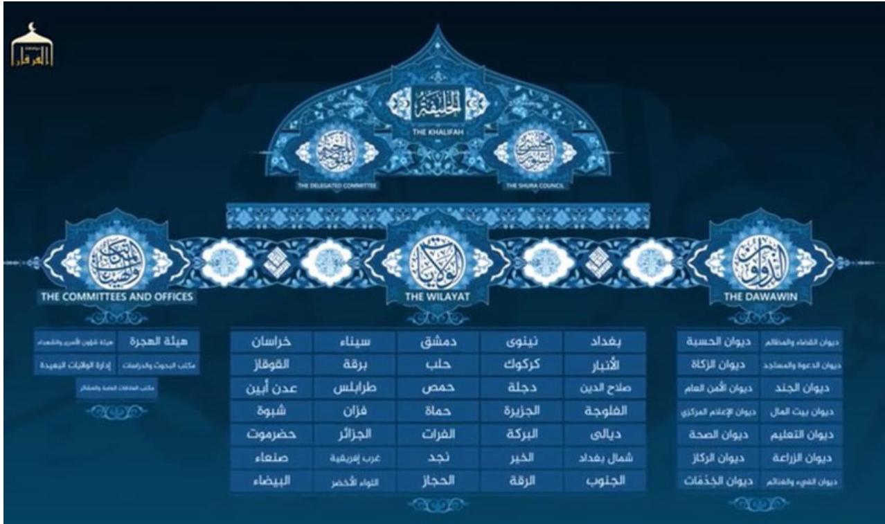
الجدول 1. الشرح المفصل الذي يقدمه تنظيم داعش لهيكله الإداري، بما في ذلك الديوان، كما هو منشور في «صرح الخلافة». 8

هذا الديوان في التظلمات ضد مسؤولي الدولة فيما يتعلق بقضايا الأموال العامة وقوانين الأراضي والأوقاف والشكاوى وجميع المسائل الأخرى التي اختارت الحكومة أن تصنفها في إطار الشكاوى، والتي تُعرف مجتمعة باسم ولاية المظالم. 7